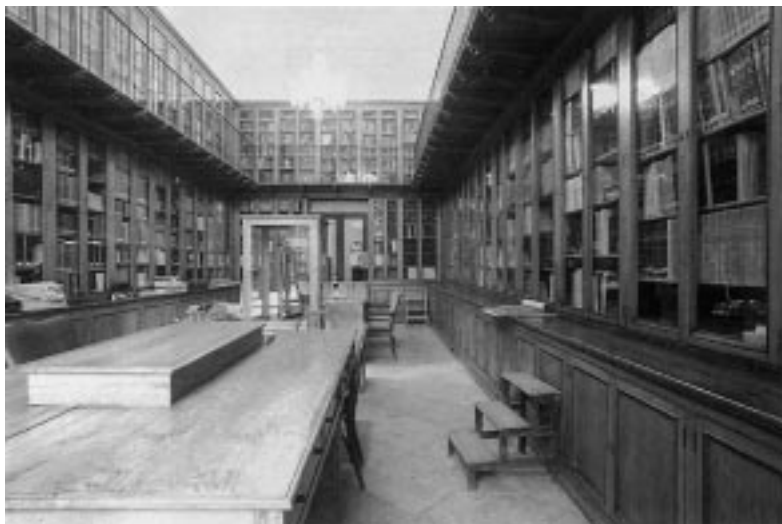
Figura 3: Biblioteca del Observatorio Astronómico de Madrid, situada en el ala oeste del edificio Villanueva.

El edificio de Villanueva alberga en la actualidad la “Colección de Instrumentos”, siendo el museo de ciencias astronómicas más importante de nuestro país. Recientemente se ha instalado el péndulo Foucault con fines didácticos. También dispone de una valiosa biblioteca con la documentación más antigua y extensa sobre temas de Astronomía de cuantas hay en España. Otro edificio alberga el Gran Ecuatorial de Grubb (1922). También acoge los relojes atómicos, utilizados para el servicio de la Hora.