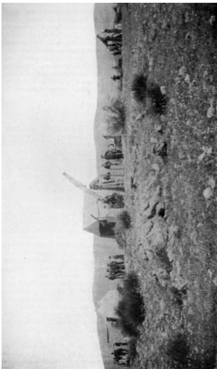
Figura 4: Campamento en Berrocalillo montado por el OAM para la observación del eclipse total de Sol de 28 de mayo de 1900.