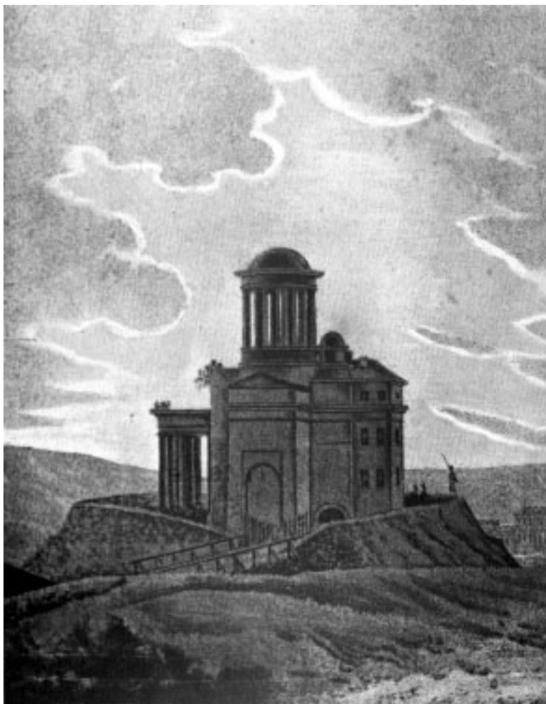
Figura 1: El edificio Villanueva convertido en un polvorín por las tropas francesas a principios del siglo XIX.

de los monasterios suprimidos. Pero la mala política del rey prolonga el abandono. Los intentos por revivirlo son fallidos y se carece de personal e instrumentación. De 1824 a 1840, el Observatorio parece estar abandonado. Sólo en 1841 revivirá, pero reducido a Observatorio Meteorológico.